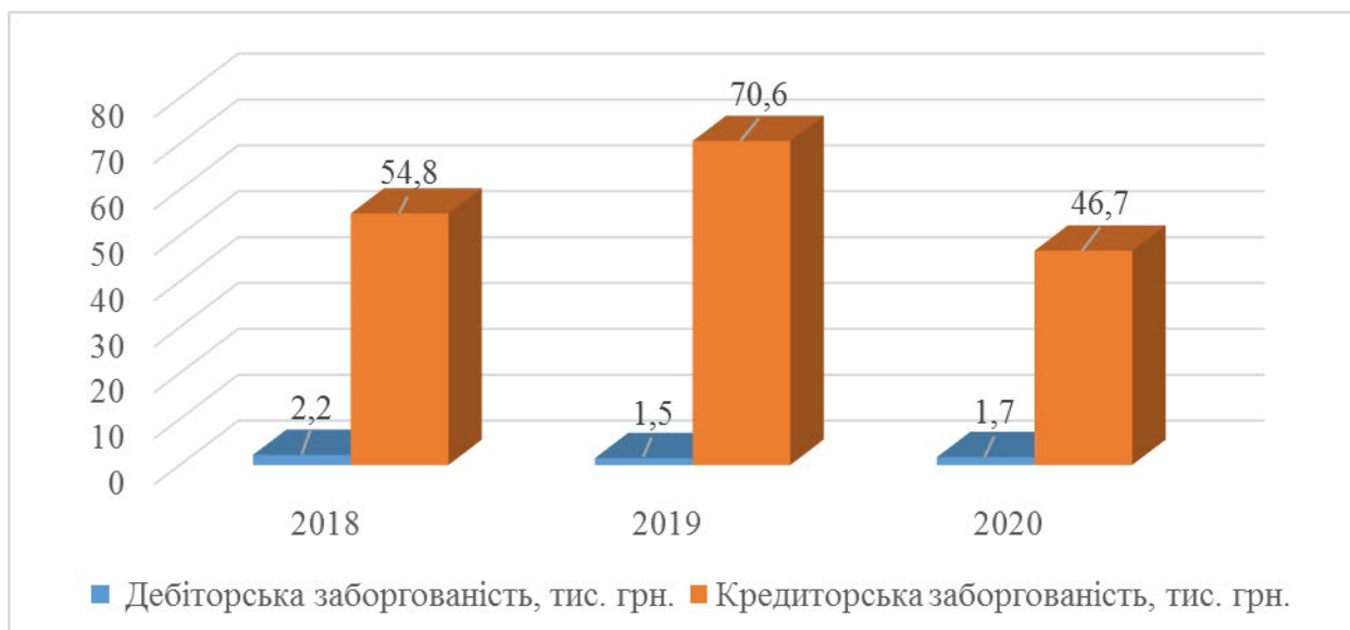
Рис. 1 Динаміка зміни дебіторської та кредиторської заборгованості ТОВ «Ювелірна фабрика «Еліт» за 2018 – 2020 р.р.

Грошові кошти та їх еквіваленти на дослідному підприємстві зростають з 96 тис. грн. у 2018 році до 603,4 тис. грн. або на 507,4 тис. грн.. Питома вага грошових коштів у складі оборотних активів також зростає з 42% до 82%. Найбільший приріст даної статті балансу відбувся у 2020 році і склав 459,8 тис. грн. в порівнянні з 2019 роком, або зріс з 143,6 тис. грн. до 603,4 тис. грн.