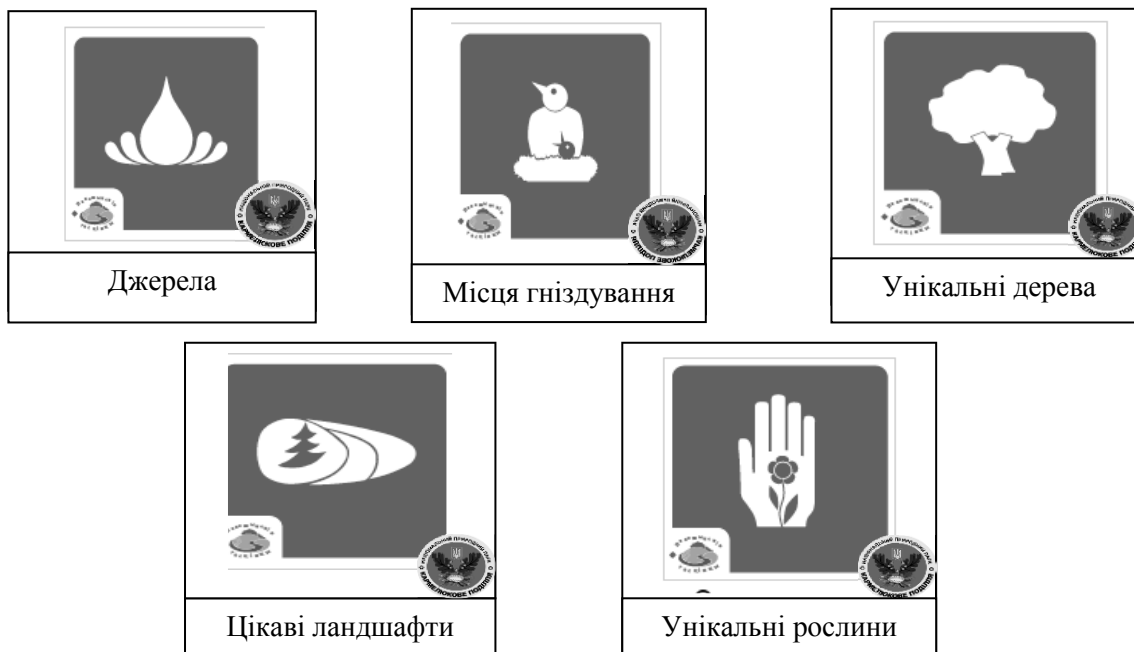
Рис.2. Природоохоронні знаки, розроблені для НПП «Кармелюкове Поділля»

Особливу увагу слід звернути тим туристам, які цікавляться таким видом екологічного туризму як екологічно-пізнавальний. Адже завдяки єдиному національному природному парку можна сформувавши цікавий пізнавальний екотур «Загублений світ» (табл. 1).