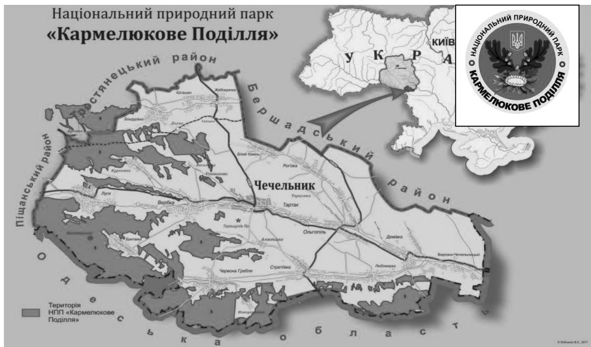
Рис.1. Карта Національного природного парку «Кармелюкове Поділля»

єдиному у Вінницькій області Національному природному парку «Кармелюкове Поділля» незаконно винищують заповідні ліси. Під загрозою зникнення столітні дуби та інші цінні породи дерев, які саджали ще наші прадіди. Зокрема, в газеті «33 канал» (№7 від 6.02.2013 р., с. 7. і №8 від 13.02.2013 р., с. 6) в публікаціях «Національний парк Кармелюкове Поділля незаконно вирубують».