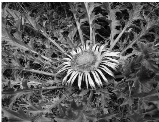
Рис. 3. Відкашник татарниколистий – унікальна рослина України