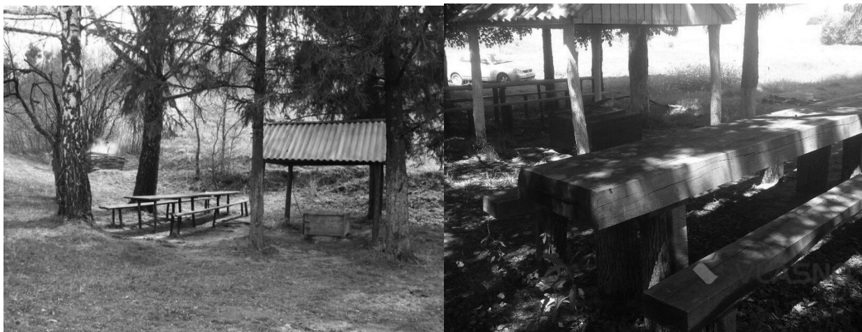
Рис. 4. Спеціально облаштована територія для екотуристів в НПП «Кармелюкове Поділля»

Урочище «Вишенька» приваблює відпочиваючих неповторними краєвидами, рослинами, що занесені до Червоної книги України, зручним місцем розташування, наявністю джерельної води, що сприяло створенню імпровізованого місця відпочинку (рис. 4.) [5, с. 123].