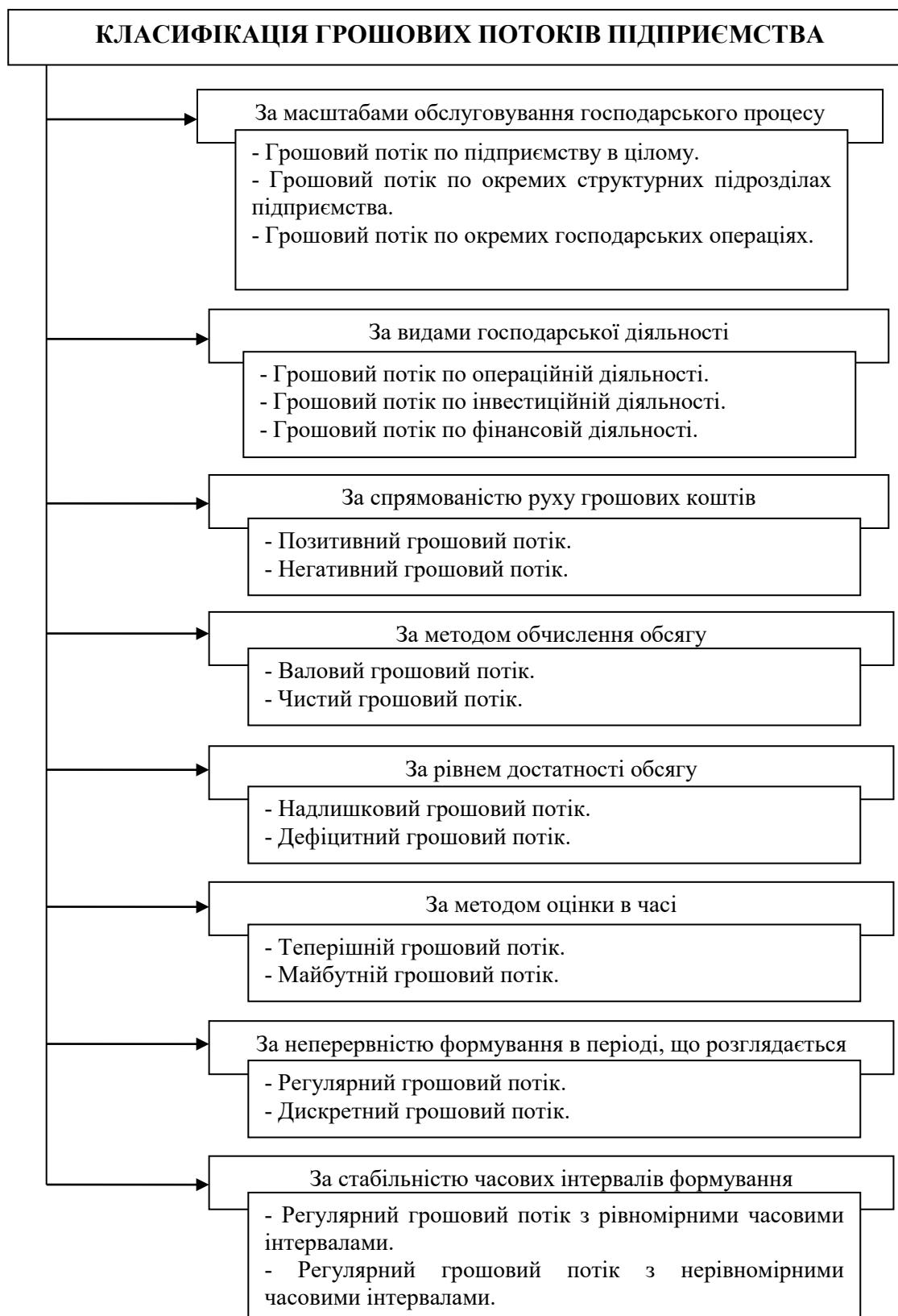
Рис.1. Класифікація грошових потоків підприємства [1]

За спрямованістю руху коштів виділяють два основних види грошових потоків: вхідний та вихідний грошовий потік.