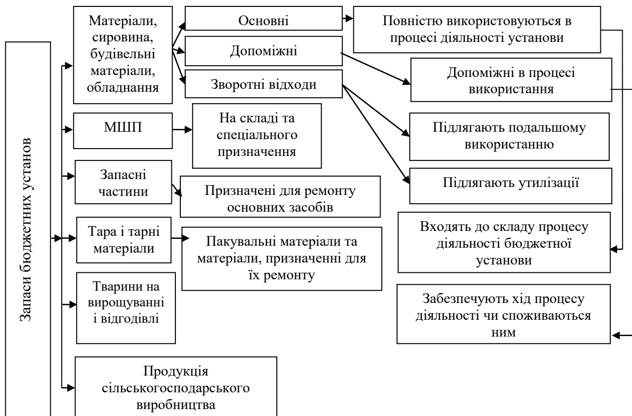
Рис. 2. Рекомендована класифікація запасів бюджетних установ