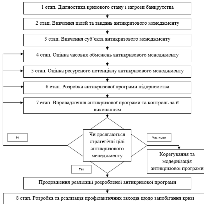
Рис. 1. Концептуальна модель антикризового менеджменту [2, с. 60]

Концептуальна модель антикризового менеджменту передбачає виконання кількох етапів (рис. 1).