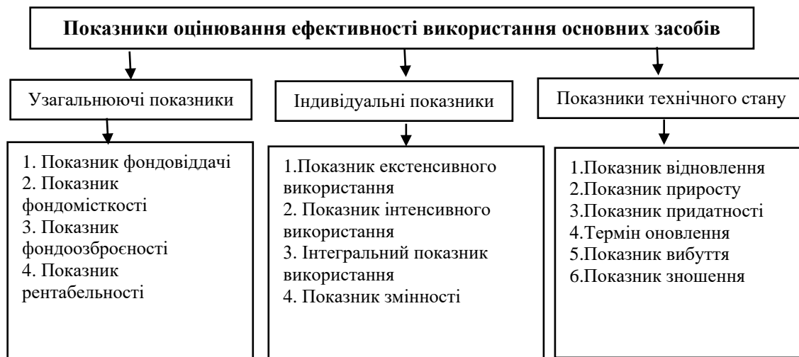
Рис.2. Показники аналізу ефективності використання основних засобів [9]

Сучасні підходи щодо оцінювання ефективності використання основних засобів досить різноманітні, однак вони ґрунтуються на оціночних показниках: показники, що характеризують технічний стан; узагальнюючі показники використання та індивідуальні показники використання основних фондів (рис. 2).