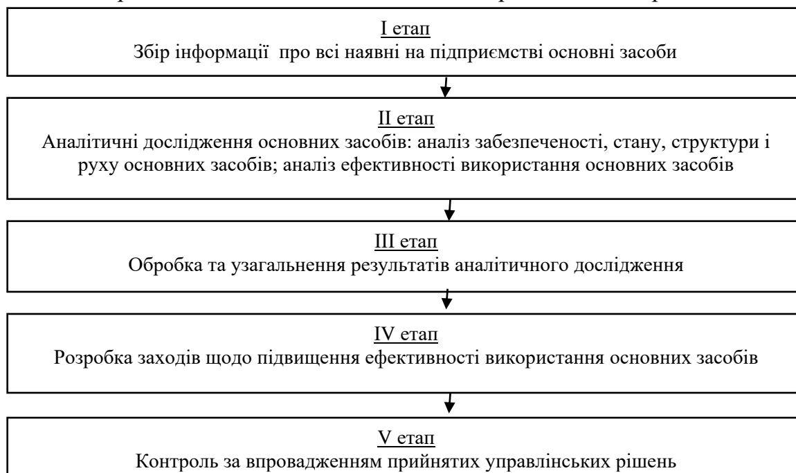
Рис. 1. Послідовність оцінювання основних засобів

Оцінка ефективності використання основних засобів підприємства проводиться. Послідовність проведення оцінки основних засобів представимо на рис. 1.