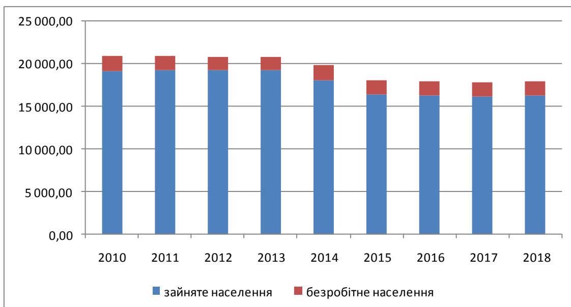
Рис. 1. Динаміка основних показників ринку праці в Україні за 2010-2018 рр.

Аналізуючи сучасну демографічну ситуацію в Україні, необхідно відзначити, що вона визначається, головним чином, зниженням народжуваності, ростом смертності, збільшенням хронічних захворювань, скороченням тривалості життя.