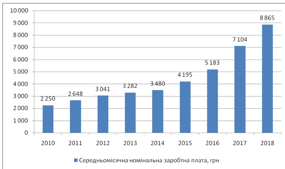
Рис. 3. Динаміка номінальної заробітної плати в Україні за 2010-2018 рр.

Графічне зображення динаміки середньомісячної заробітної плати відображено на рис. 3.