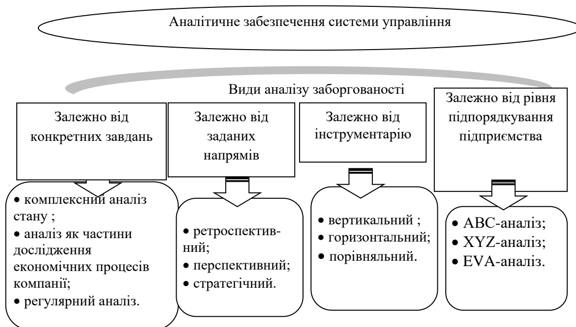
Рис. 1. Основні напрями аналізу заборгованості підприємства

Напрями аналізу заборгованості підприємства наведені нами на рис. 1.