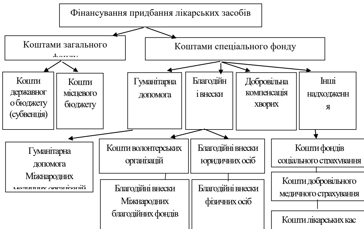
Рис. 1 Джерела фінансування придбання комунальними неприбутковими закладами лікарських засобів

Основні джерела фінансування придбання комунальними неприбутковими закладами лікарських засобів зображені на рис. 1.