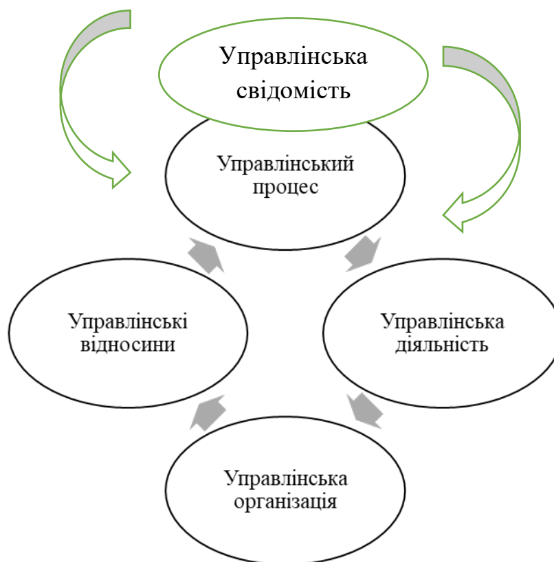
Рис.1 Структура фінансової політики підприємства