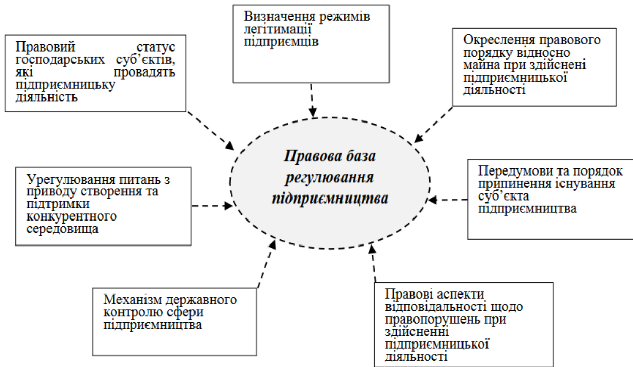
Рис. 2. Напрями правового регулювання підприємництва [4]

Підсумовуючи рис. 2 відзначимо, що сьогодні українське законодавство регулює підприємницьку діяльність за трьома ключовими напрямками: